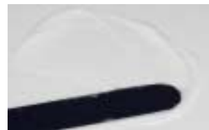
A Ketac™ Cem Plus könnyen adagolható és keverhető