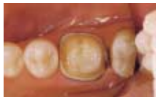
A csomk preparálása koronához