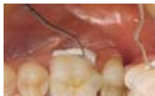
Felhelyezés: a ragasztó cement felesleg könnyen eltávolítható