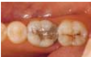
Megrepedt, régi amalgám tömés